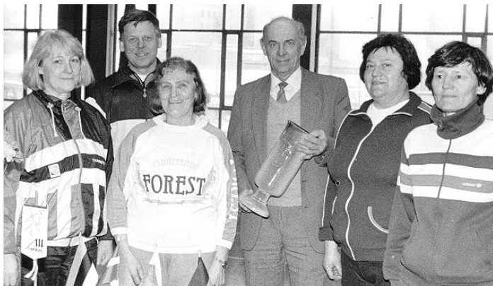
Vilniaus miesto meras Vytautas Jasulaitis su grupe varžybų dalyvių.