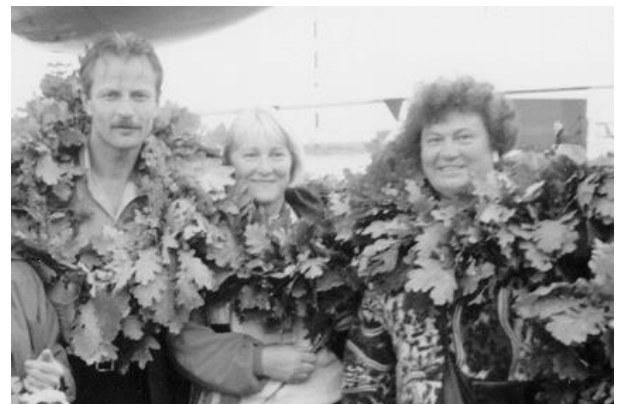
Iš tolimosios Australijos sugžūs