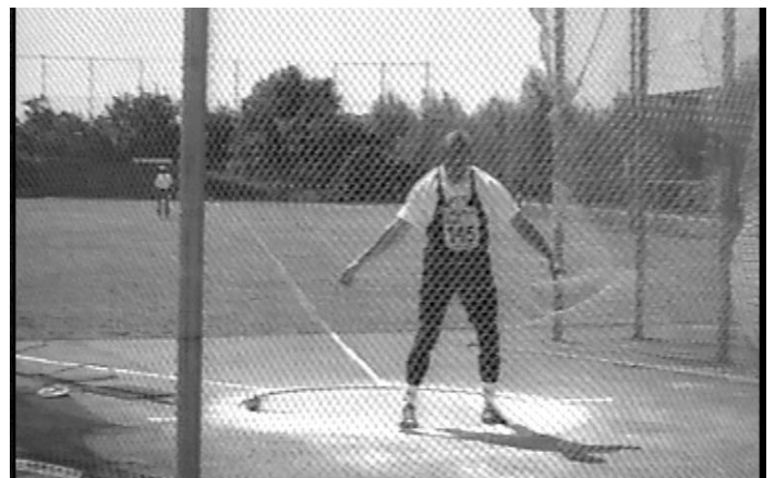
Europos pirmenybės Malmėje